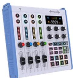
1 console NUMETIS WeSpeak avec une carte SD 32 GB