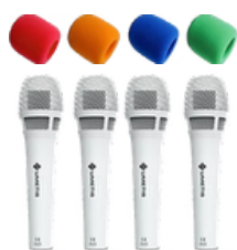
4 microphones NUMETIS WeSpeak