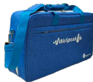
1 sacoche NUMETIS WeSpeak