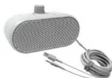
1 enceinte NUMETIS WeSpeak