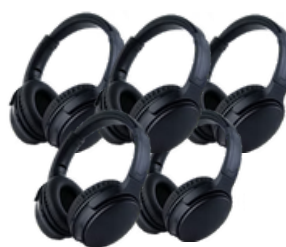
5 casques NUMETIS WeSpeak