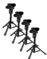
4 supports micros NUMETIS WeSpeak